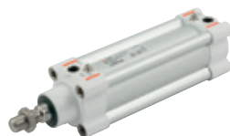
Vérins série HCR (High Corrosion Resistance) suivant la norme ISO 15552 diamètres du 32 au 125 mm