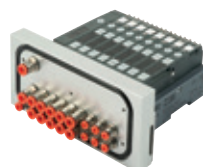
Ilots de distribution pour les zones de projection, série HDM, EB 80 de 4 à 16 électrodistributeurs