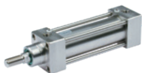
Vérins en acier inoxydable suivant la norme ISO 15552 diamètres du 32 au 125 mm