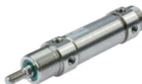
Vérins ronds en acier inoxydable diamètres du 32 au 63 mm