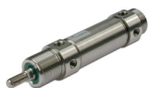
Круглые цилиндры из нерж. стали, диаметры поршня от 32 до 63 мм