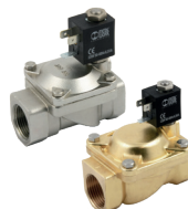
Арматурные электромагнитные клапаны, с мембраной, корпусом из латуни или нержавеющей стали.