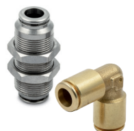
Цанговые фитинги из латуни, не содержащей свинца, серии F-E и F-NSF, трубки диаметром от Ø 4 до 10 мм, резьба от M5 до 1/2".