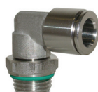
Цанговые фитинги из нержавеющей стали AISI 316, трубки диаметром от Ø 4 до 12 мм, резьба от M5 до 1/2".