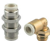
Автоматические фитинги из латуни, не содержащей свинца, серии F-E PLUS и F-NSF PLUS, трубки диаметром от Ø 4 до 10 мм, резьба от M5 до 1/2"